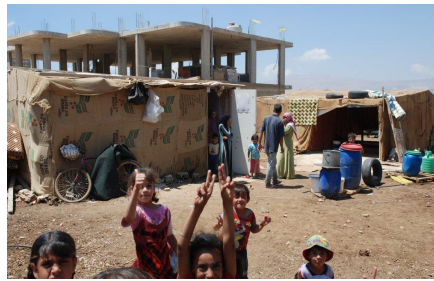
Kinder im illegalen Flüchtlingslager in Talabaya

Laut dem Flüchtlingswerk der UN gibt es offiziell bereits etwa 200.000 syrische Flüchtlinge in Libanon. Die inoffiziellen Schätzungen gehen von mehr als das Doppelte aus. Derzeit überqueren ca. 2.000-3.000 Menschen täglich die Grenze zum Nachbarland. Etwa 75% aller Flüchtlinge sind Frauen und Kinder. Viele der Flüchtlinge aus Syrien z.B. in der Bekaa-Ebene wohnen bei Angehörigen oder hausen in erbärmlichen Unterkünften und versuchen zu überleben. Im Winter wird es dort sehr kalt. Um ihr Überleben zu sichern, benötigen sie dringend warme Decken, Kleidung sowie haltbare Lebensmittel. Ebenso dringend benötigt werden Spendengelder, um den Transport dorthin per Seecontainer sicherstellen zu können.